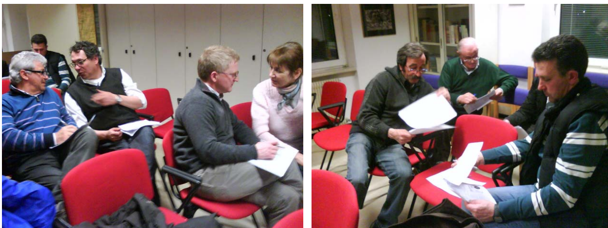
Figura 3: Secondo Forum, la discussione in piccoli gruppi

La sfida che il forum si è trovato ad affrontare consiste nella capacità di poter coniugare le eventuali difficoltà manifestate dagli emigrati da Grigno con le attese dei nuovi venuti. Si tratta di un processo che propone di progettare il futuro sostenibile del paese sapendo guardare anche al proprio passato recente con le sue difficoltà, e al suo presente.