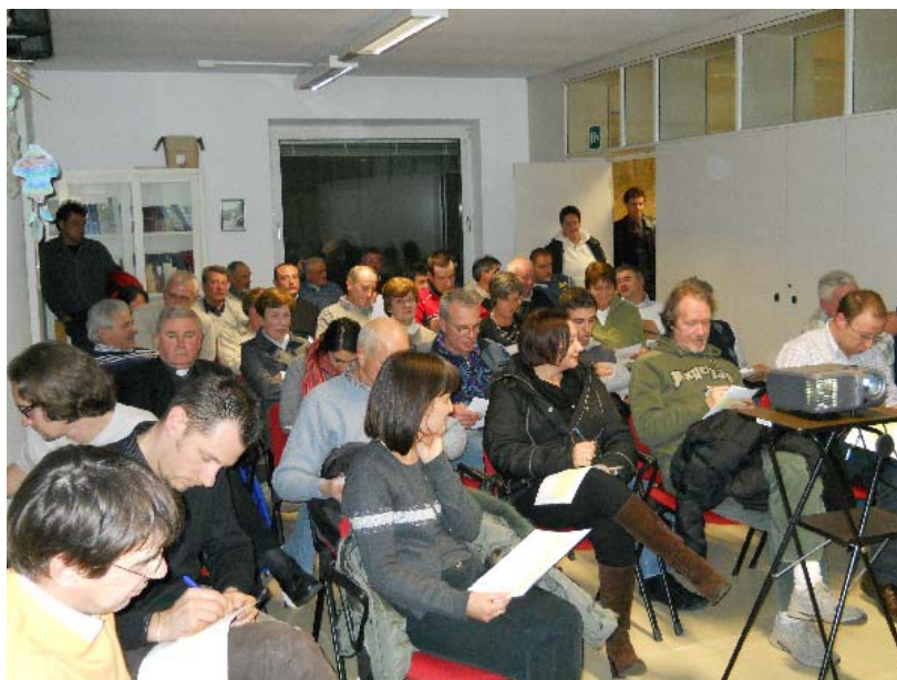
Figura 2: I partecipanti al primo Forum

La sala della biblioteca ha accolto un elevato numero di partecipanti, che nella prima parte della serata, hanno ascoltato la presentazione dei lavori, e in seconda serata, hanno partecipato attivamente ai lavori indicando alcune idee, attraverso l'attività di Vision. Gli intervenuti dovevano indicare in due differenti post-it desideri e preoccupazioni per il proprio territorio da qui ai prossimi vent'anni. In totale 26 persone hanno fornito indicazioni utili ad elaborare un percorso comune (vedi Allegato 1).