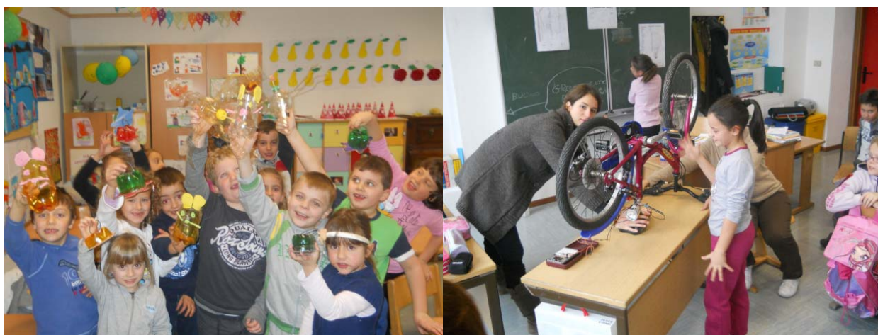
Figura 5: Attività di educazione ambientale

Nell'ambito dei percorsi partecipati e in accordo con i soggetti istituzionali è stato predisposto un intervento di educazione ambientale progettato in collaborazione con gli insegnanti della scuola primaria. Le tematiche affrontate sono state due: i rifiuti per la classe prima e l'energia per le classi quarte e quinte. Tre educatori hanno fatto ragionare i bambini attraverso alcuni giochi e attività sui comportamenti da assumere per avere un uso razionale delle risorse, per i più grandi, e come distinguere le varie tipologie di rifiuto per i più piccoli.