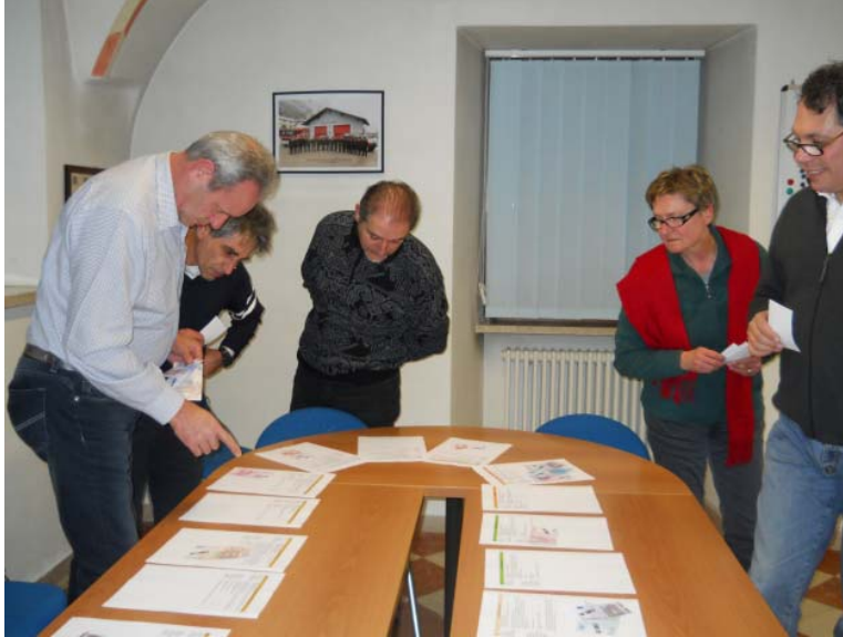
Figura 4: Terzo Forum, un momento della votazione

Anche se con una partecipazione più limitata, dovuta forse alla fredda serata e alle imminenti feste natalizie, il 20 dicembre 2011 si è concluso il percorso giungendo alla chiusura del processo. Dopo una breve presentazione del percorso si è passati all'illustrazione delle Azioni e quindi alla votazione delle stesse per determinarne la priorità di importanza.